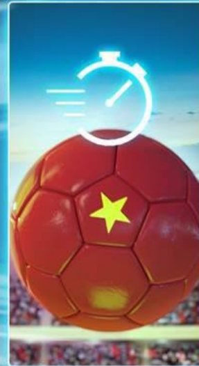
> Truy cập nhanh, dễ dàng