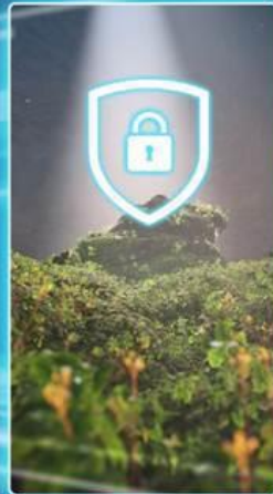
> Bảo mật tuyệt đối