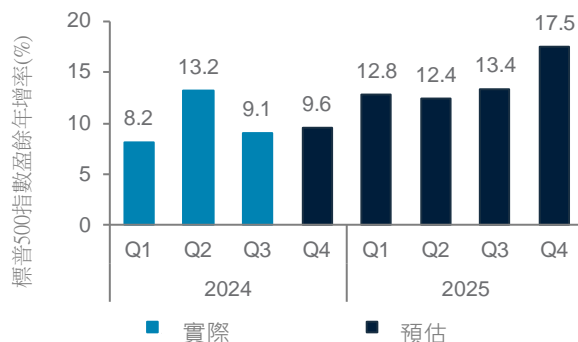
我們預期2025年盈餘成長加速將推動美股上揚 標普500指數季度盈餘年增率預估

技術面顯示，美元指數（DXY）已呈現超買，但動能指標（MACD）顯示短期仍有溫和上行壓力。若明確突破108.2，可能測試下一個阻力位109。然而，展望未來1-3個月，預期指數將維持區間震盪。長期而言，焦點可能轉向美國財政和貿易政策以及歐元區利率，支撐美元維持區間震盪走勢。