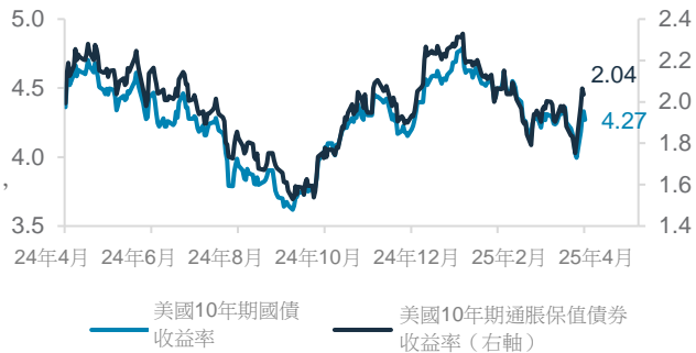
美國 10 年期國債收益率和 10 年期通脹保值債券收益率