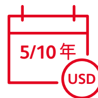
設有5年或10年供款年期 保單以美元結算