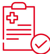
完成簡單健康申報 即可投保