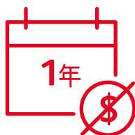
如失業或確診癌症 可享長達1年延繳保費保障