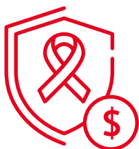
不幸患癌可獲 一筆過額外保障