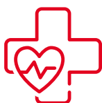
增值服務以加強您的保障