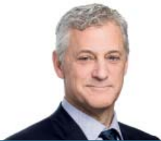
Bill Winters, CBE 集團行政總裁