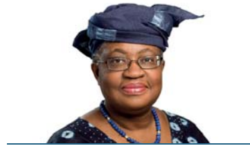
Ngozi Okonjo-Iweala博士 非執行董事

貢獻： Naguib豐富的銀行業及金融經驗以及於數家組織擔任不同的領導職位為關於本集團策略、表現及長期可持續性的討論提供強烈的銀行業及金融敏銳了解。董事會推薦Naguib重選。