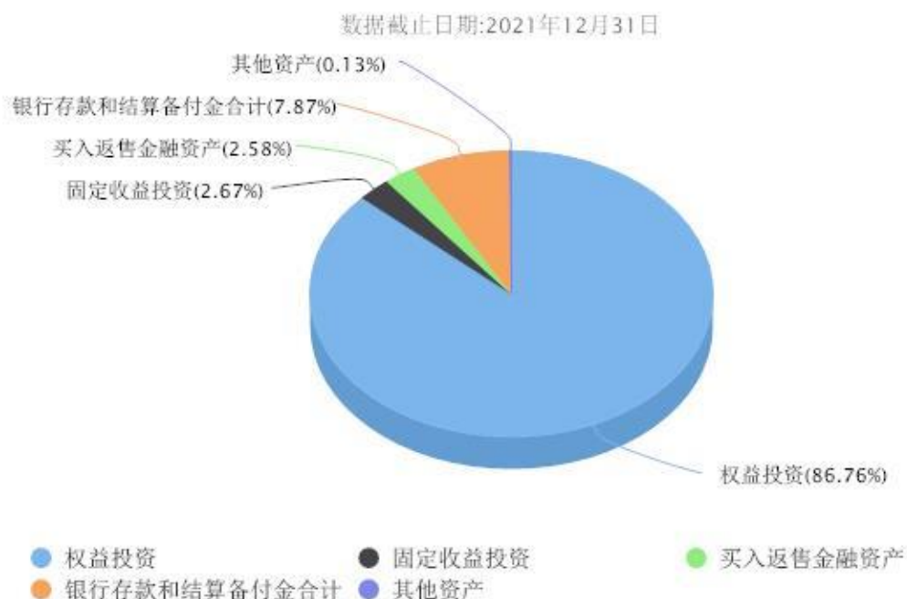
汇添富价值精选混合投资组合资产配置图表