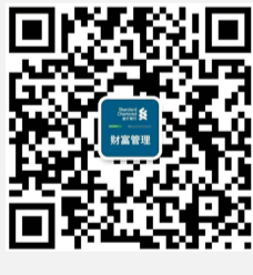
“渣打银行财富管理”微信公众号